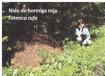
Nido de hormiga roja Formica rufa