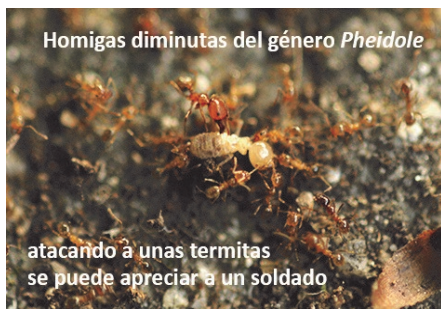
Homigas diminutas del género Pheidole

Si bien es cierto que algunas especies, especialmente las invasoras, pueden ser perjudiciales para los seres humanos, las hormigas son un elemento fundamental de la vida del planeta y merecen el mismo respeto que otros seres vivos más vistosos.