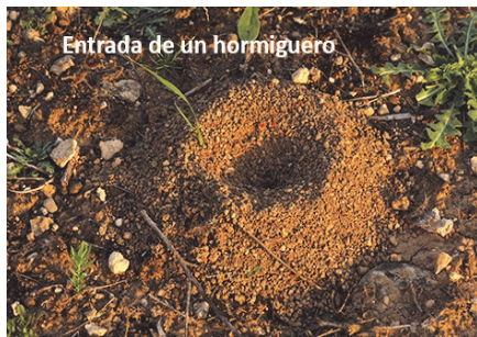
Entrada de un hormiguero

atacando a unas termitas se puede apreciar a un soldado