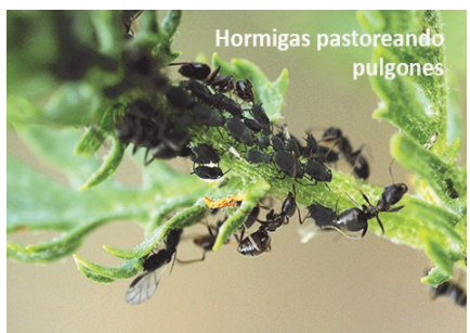
Hormigas pastoreando pulgones