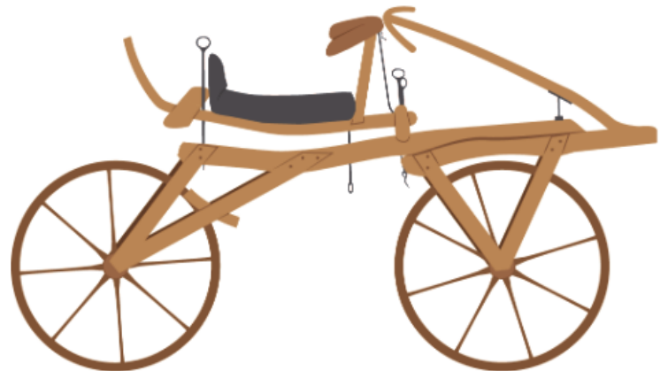
Primera bicicleta ideada por el alemán Karl von Drais allá por 1817

Plasmamos en este número dos testimonios sobre este tema: