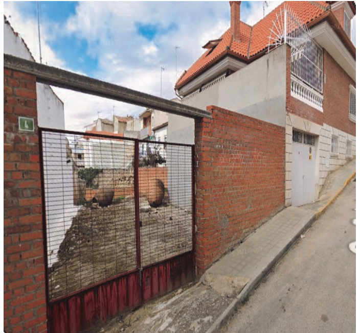
Estas tinajas , vestigio de un pasado de bodegas, uvas, vendimia y vinos en nuestro pueblo, están en la calle Cristo, en el número 4