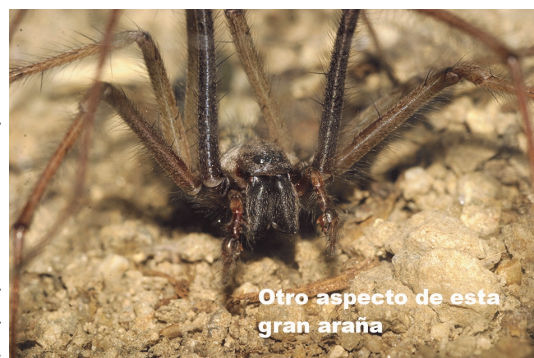
Otro aspecto de esta gran araña

Tras la cópula, la hembra pone los unos 60 huevos en un saco de seda de donde emergerán las crías que permanecen juntas durante aproximadamente un mes, pero no cooperan en la captura de presas. Este comportamiento es algo inusual en las arañas y se conoce como comportamiento "subsocias". Estas crías mudarán siete u ocho veces antes de alcanzar el estado adulto.