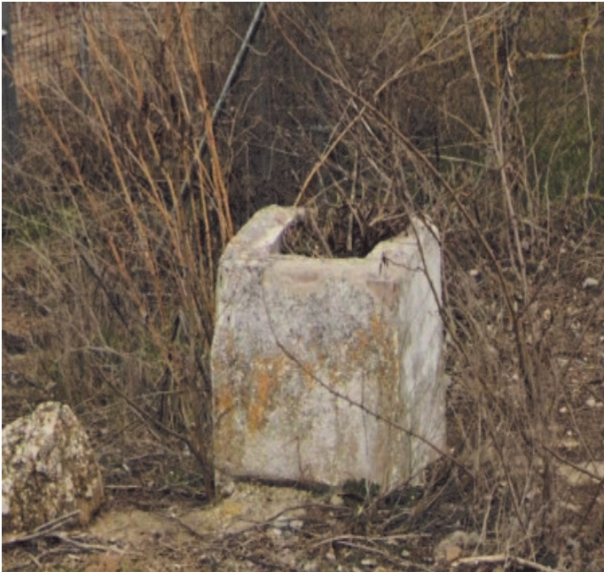
¿Qué es esto, dónde está y que utilidad tenía? Una pista: Caminante no hay camino, se hace camino al andar.