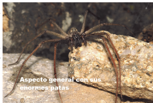
Aspecto general con sus enormes patas

La educación y el conocimiento son el verdadero antídoto contra la ignorancia que lleva al ser humano a eliminar a cualquier ser vivo desconocido. No sé si es por el antiguo mito de Aracne, la tejedora que desafió a Atenea y que, por su arrogancia y el orgullo de la diosa, fue convertida en este animal que lleva su nombre, pero las pobres arañas inspiran un miedo y una repugnancia que no se merecen.